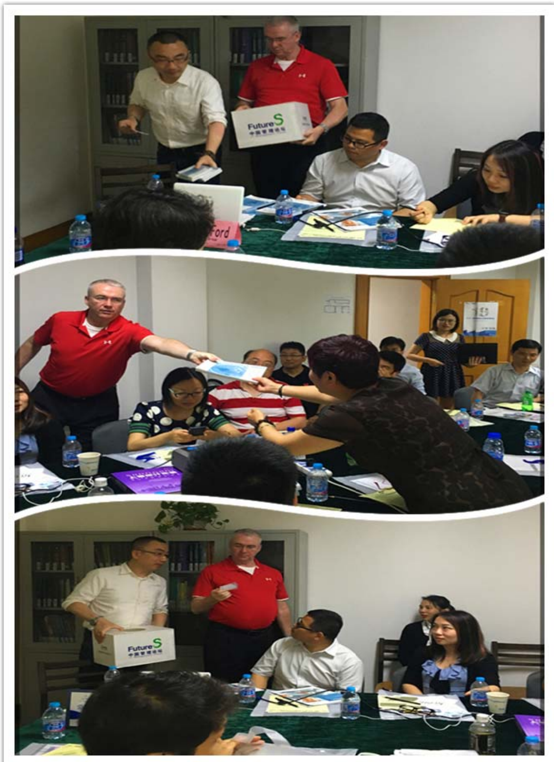
彩蛋抽奖发书环节